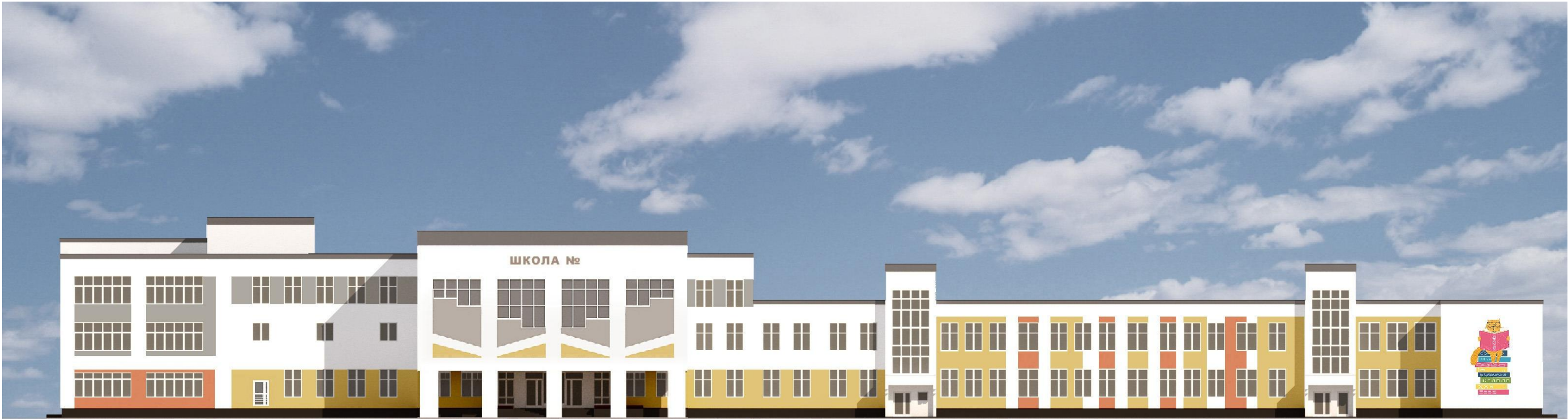
Ведомость наружной отделки