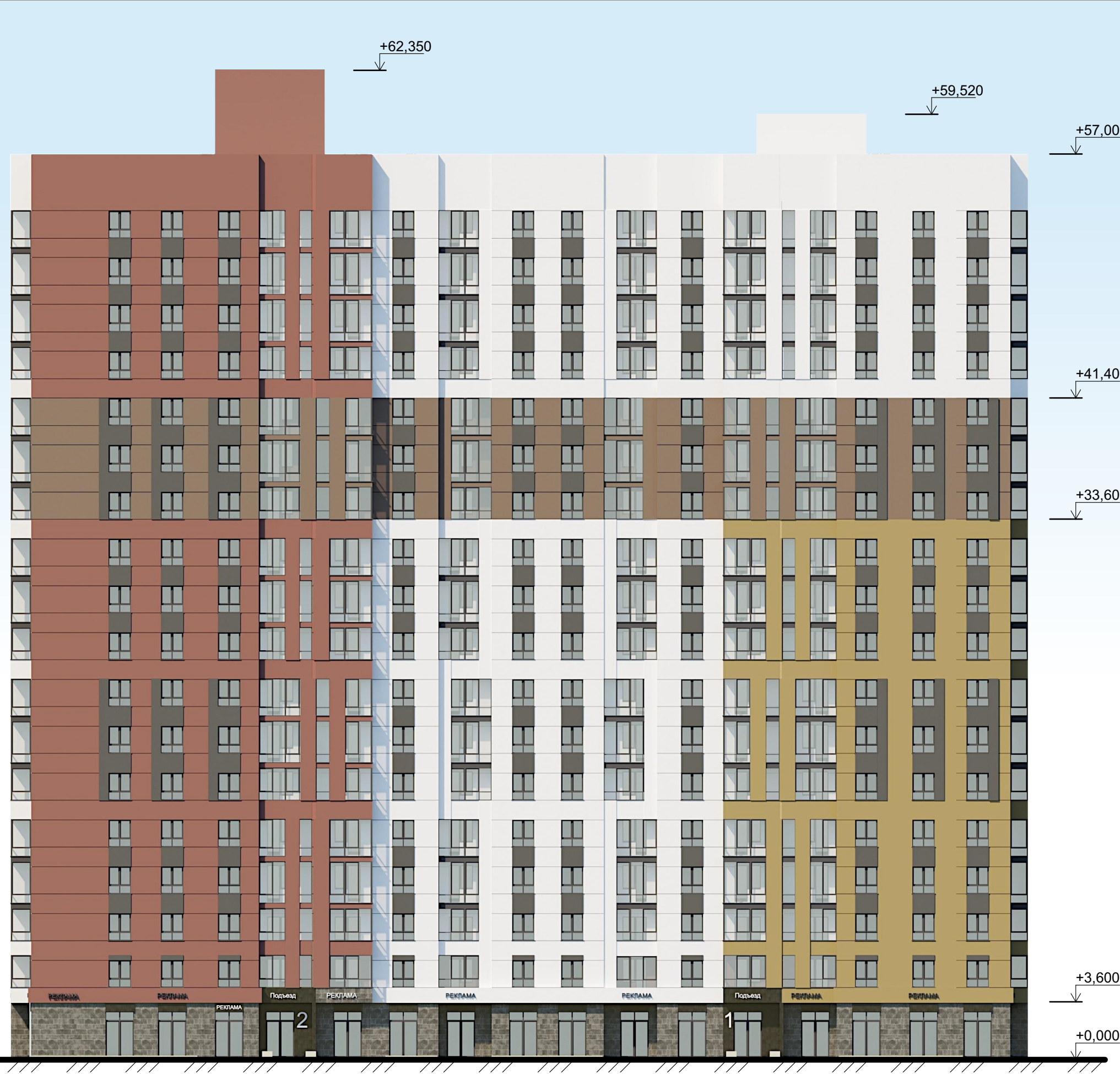
Ведомость отделки фасадов