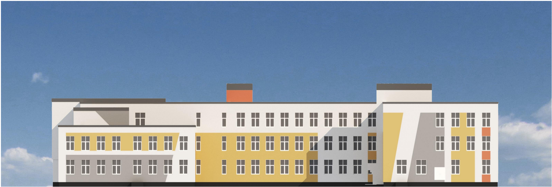
Фасад в осях "1-22". Вариант 2