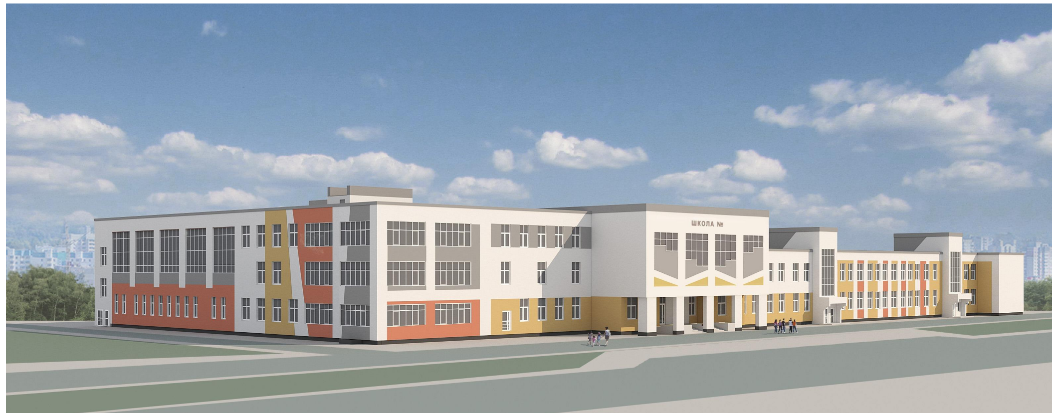
Перспективный вид 1. Вариант 2